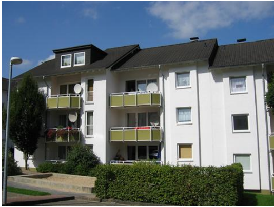
In der Becke 17

große 3 Zimmerwohnung im Erdgeschoss mit Balkon