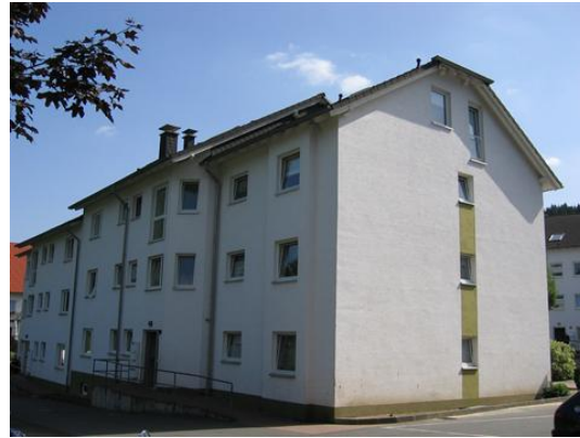
In der Becke 17